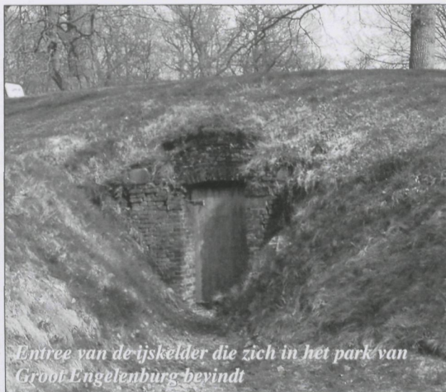
Entree van de ijskelder die zich in het park van Groot Engelenburg bevindt

Er loopt een kwart rond gewelfde gang naar het binnenste