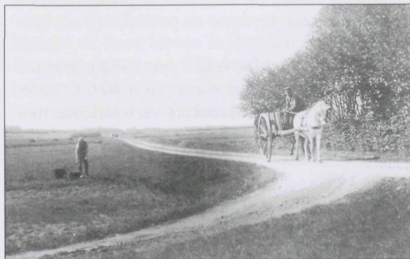
Bij de omslagfoto: Loenen omstreeks 1900. De Arnhemseweg voert door een eeuwenoud hei- delandschap. Kaart uitgegeven door de lichtdrukkerij Schalekamp te Buiksloot (Amsterdam).