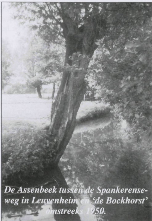
De Assenbeek tussen de Spankerenseweg in Leuvenheim en 'de Bockhorst' omstreeks 1950.

In 1768 kwam de meester-metselaar en aannemer Carel Otto van Kesteren uit Arnhem naar Laag-Soeren. Het was zijn bedoeling om in Laag-Soeren een buitenplaats aan te leggen. Dit heeft destijds tot ernstige conflicten met de markegenoten geleid, maar uiteindelijk kreeg hij zijn zin. Hij bouwde in 1770 een landhuis genaamd 'Huize Soeren', waarbij ook een grote vijver met sloten werden aangelegd. Tussen 1791 en 1805 heeft Van Kesteren in Laag-Soeren ook nog 4 watermolens gebouwd 5 . Om vijver en watermolens van voldoende water te kunnen voorzien waren ingrijpende waterstaatkundige aanpassingen nodig. Toen Van Kesteren in Laag-Soeren aankwam, was daar een enkele, kronkelende beek die gevoed werd met kwelwater uit het veen. Deze oude waterloop werd rechtgetrokken en doorgetrokken tot aan hoger gelegen grond waar een spreng werd aangegraven om zodoende meer water te krijgen. Deze waterloop werd ook opgeleid, d.w.z. hoger gelegd om meer verval te krijgen.