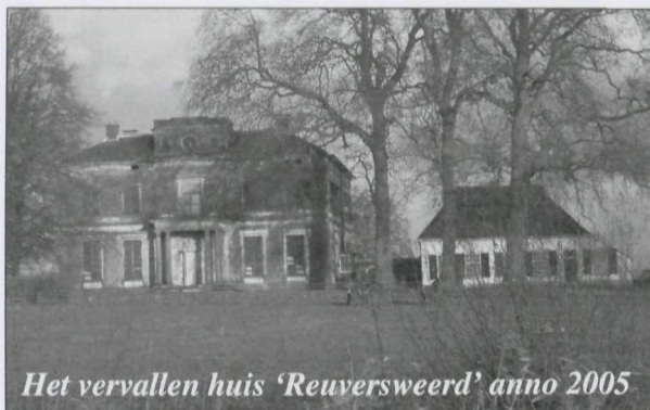
Het vervallen huis 'Reuversweerd' anno 2005