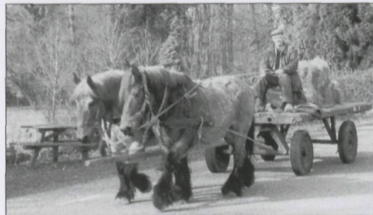
Bij de omslagfoto: Hendrik-Jan Wassink onderweg in Leuvenheim nabij 'Klein Sion', vroeger 'De Rees'.