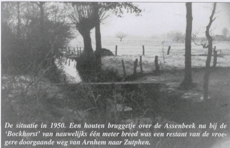
De situatie in 1950. Een houten bruggetje over de Assenbeek na bij de 'Bockhorst' van nauwelijks één meter breed was een restant van de vroegere doorgaande weg van Arnhem naar Zutphen.

ook niet ver van 'de Bockhorst' af hebben gelegen. De doorgaande route van Arnhem naar Zutphen liep eeuwenlang via de huidige Bockhorstweg in Spankeren, vervolgens voor het huis 'de Bockhorst' langs, over de Assenbeek naar Leuvenheim, Brummen en tenslotte Zutphen. Dit was omdat een deel van de huidige weg van Dieren naar Zutphen in de winter niet begaanbaar was, doordat bij hoog water in de IJssel de beek niet meer kon afwateren op de IJssel en buiten de oevers trad.