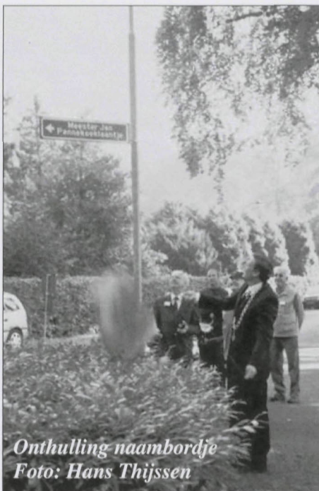
Onthulling naambordje

Op 1 januari 1873 stond meester Pannekoek in Vaassen, maar een paar jaar later werd hij benoemd in Eerbeek. Ook hier bleef hij niet bijzonder lang. Hij ging naar Utrecht, om daar tien jaar lang werkzaam te zijn. In het jaar 1880