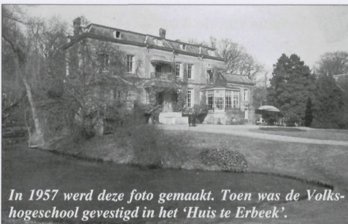
In 1957 werd deze foto gemaakt. Toen was de Volkshogeschool gevestigd in het 'Huis te Eerbeek'.