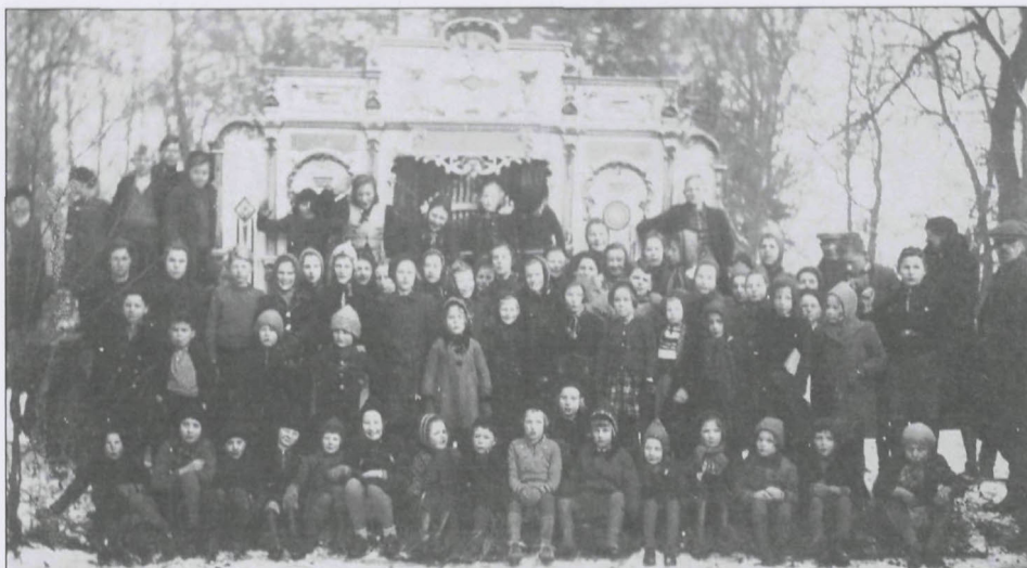
Leuvenheim 1942 tijdens ijsvermaak op de vijver van 'De Wildbaan'.

Op de Brummense Pinkstermarkt sta ik jaarlijks met een kraam met tweedehandsboeken en oude ansichtkaarten. Steevast heb ik al ruim tien jaar een oproep aan de kraam hangen, waarin ik vraag om gegevens over Brummens IJsclub betreffende de periode 1949 – 1958, het jaar dat de club – volgens informatie – definitief ter ziele is gegaan. De reacties zijn niet bemoedigend en beperken zich meestal tot de opmerking: "Ik zal thuis nog wel eens even kijken, of ik nog iets voor je heb." En dan houdt het spijtig genoeg op.