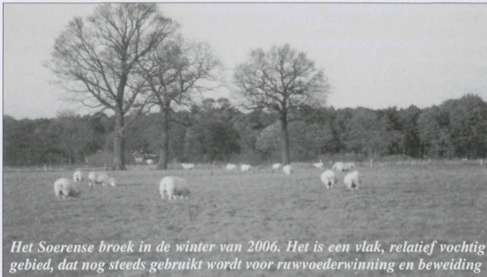
Het Soerense broek in de winter van 2006. Het is een vlak, relatief vochtig gebied, dat nog steeds gebruikt wordt voor ruwvoederwinning en beweiding

In 1669 erkende het Hof van Gelre dat Herman van Delen bevoegd was om in de mark van Soeren of in het district van Spankeren naar water te graven en wanneer het water gevonden was, daarop één of meer molens te mogen bouwen 17 . Het graven naar water betekende hier waarschijnlijk het aangraven van sprengen.