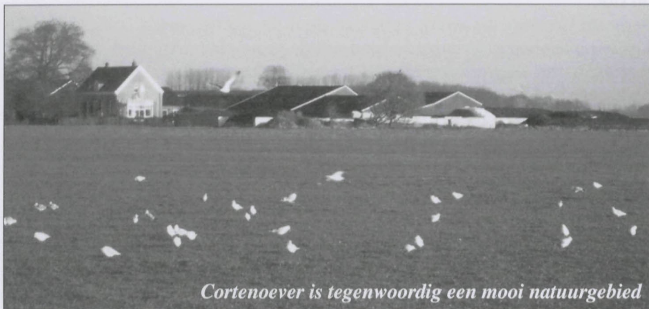
Cortenoever is tegenwoordig een mooi natuurgebied

ring van Cortenoever is ook gekomen door de aanleg van de snelweg Brummen-Zutphen (1972). Vroeger was het landschappelijk gezien erg mooi, het gebied was groen van de vele grote bongerds met allemaal hoogstambomen. Er stonden om alle boerderijen ook veel populieren en lindebomen. Nu is het een kaal vlak gebied geworden.