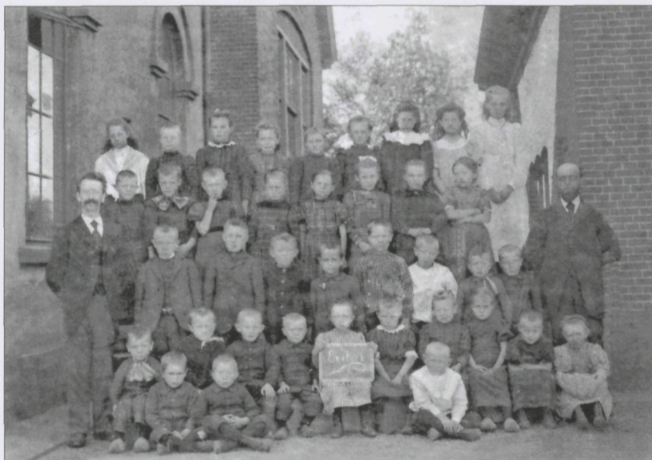
Foto schoolklas Openbare Lagere School Eerbeek 1901