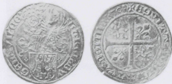
Voor- en achterzijde van een dubbele stuiver uit 1501 ten tijde van hertog Karel de Stoute

*) en **) Denk aan de uitdrukkingen: 'oortje versnoept' en 'een duit in het zakje doen'.