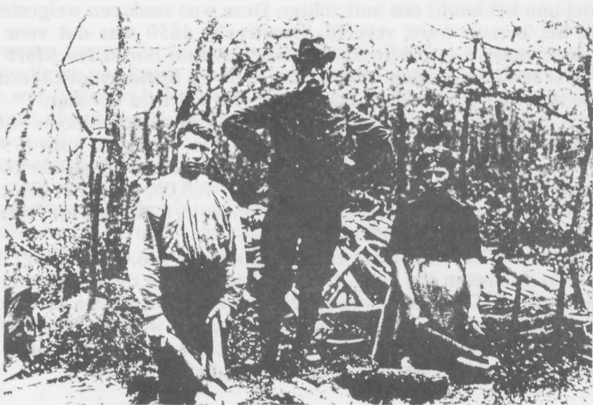
2. Een tweetal eekschillers uit Elspeet bij het z.g. witmaken 1927.