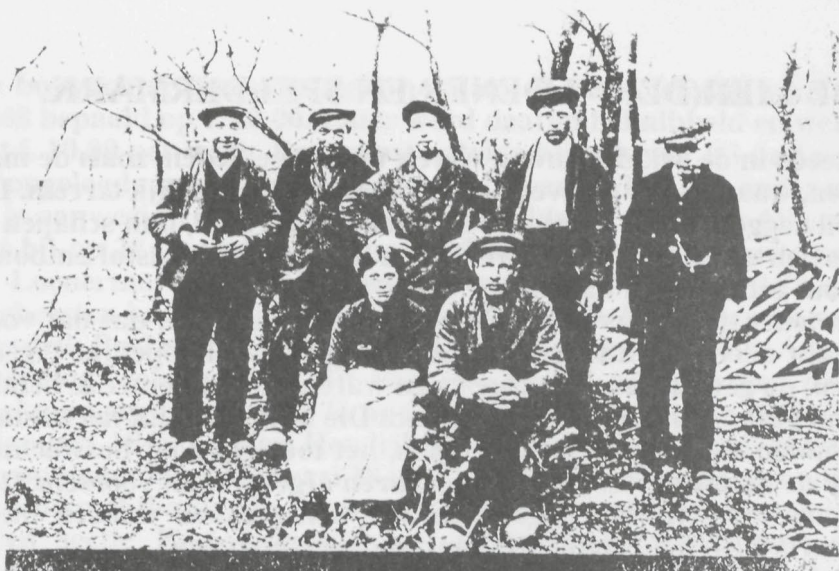
1. Groep Elspeetse eekschillers in de buurt van Hoog Soeren 1927.