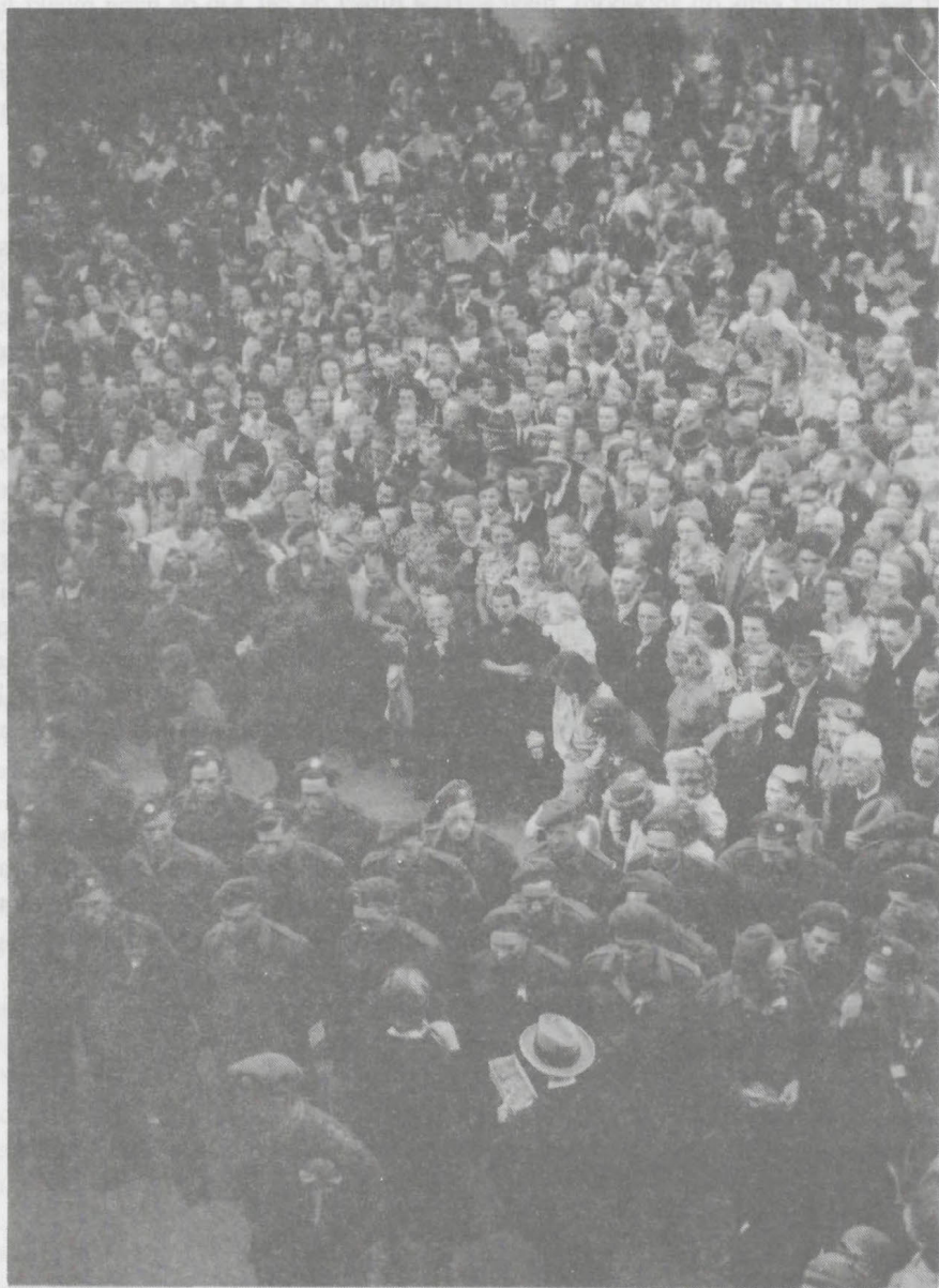
Huldiging van de Canadese bevrijders voor hotel-café-restaurant Concordia aan de Engelenburgerlaan te Brummen.