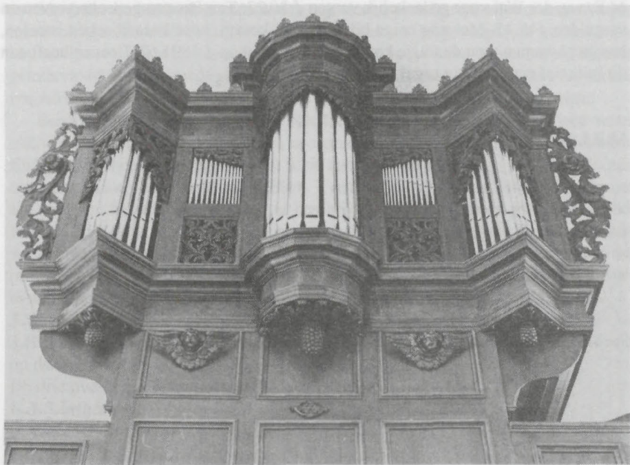
Het front van het orgel in de Nederlands Hervormde kerk te Loenen.