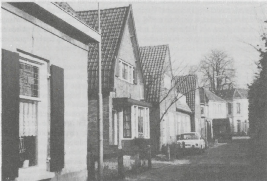
De Kruisenkstraat te Brummen, gezien in oostelijke richting. De huizen ter hoogte van de personenauto werden in 1960 afgebroken.

De boeren bedreven landbouw op akkergronden, de gemeenschappelijke engh, maar hun bezit was wel individueel. De engh was verdeeld in stukjes waarvoor de term akkers werd gebruikt. Uit latere gegevens blijkt dat er aan beide kanten van de kerk in Brummen een engh lag. Aan de noordkant de 'Brummense engh' aan de zuidkant de 'Kruisengh'. Brummen heeft nog een Kruisenkstraat. Rhienderen had ook een Zuidengh en een Noordengh met o.a. een erf "Noordinck".