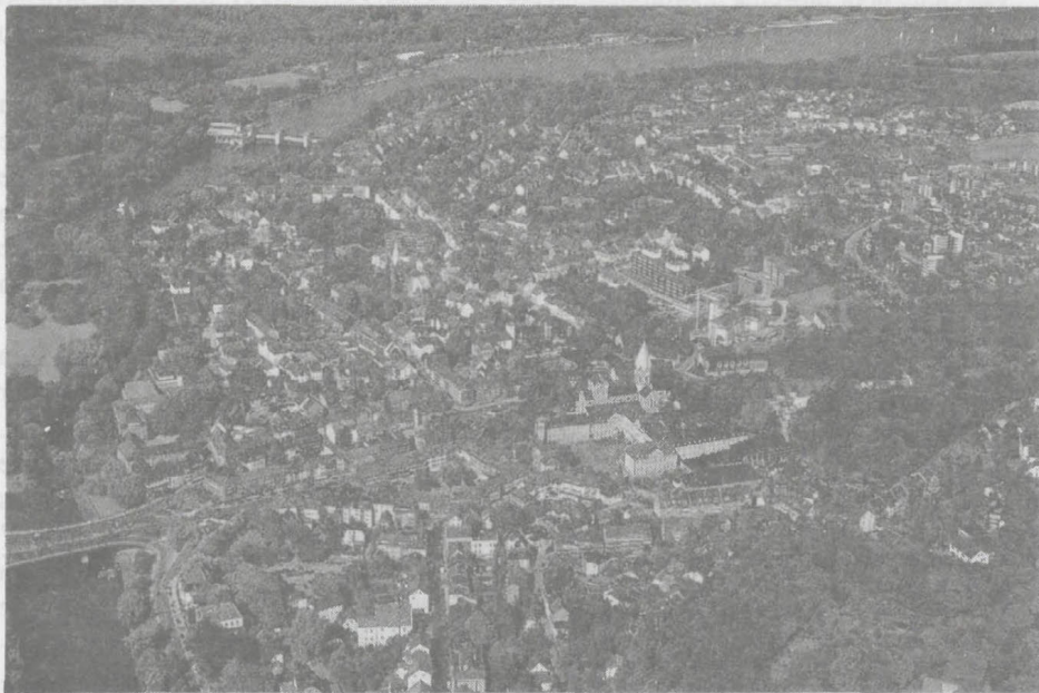
Luchtopname van Werden; in het midden het abdij-complex.

plebaan of zielzorger benoemen. Het kapittel van de nieuwe Mariakerk, de laatste kerk van het kruis (gesticht in 1081) kreeg van de bisschop de kerk van Beckbergen.