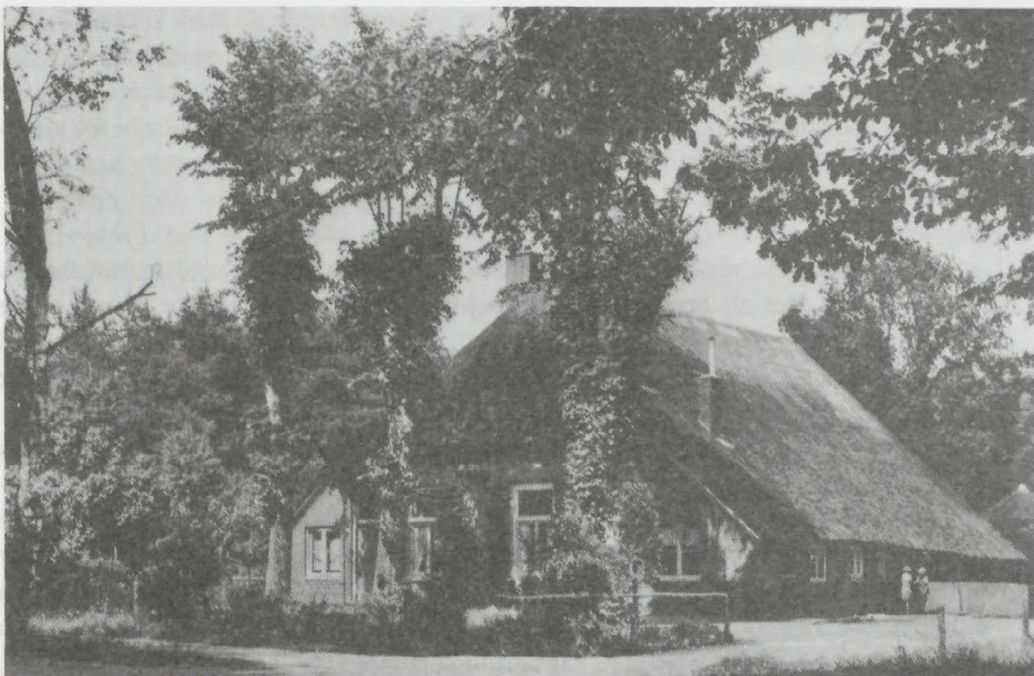
Boerderij, vroeger herberg De Vrijenberg

De weg die de verbinding vormt tussen Loenen en Beekbergen is niet zo oud als men zou veronderstellen. Aanvankelijk is er mogelijk een klein pad geweest, maar later, toen er meer verkeer kwam, is de weg breder geworden. De oude weg van Arnhem naar Deventer liep langs de boerderij De Vrijenberg. Aan de overkant van de boerderij is dat nu nog te zien.