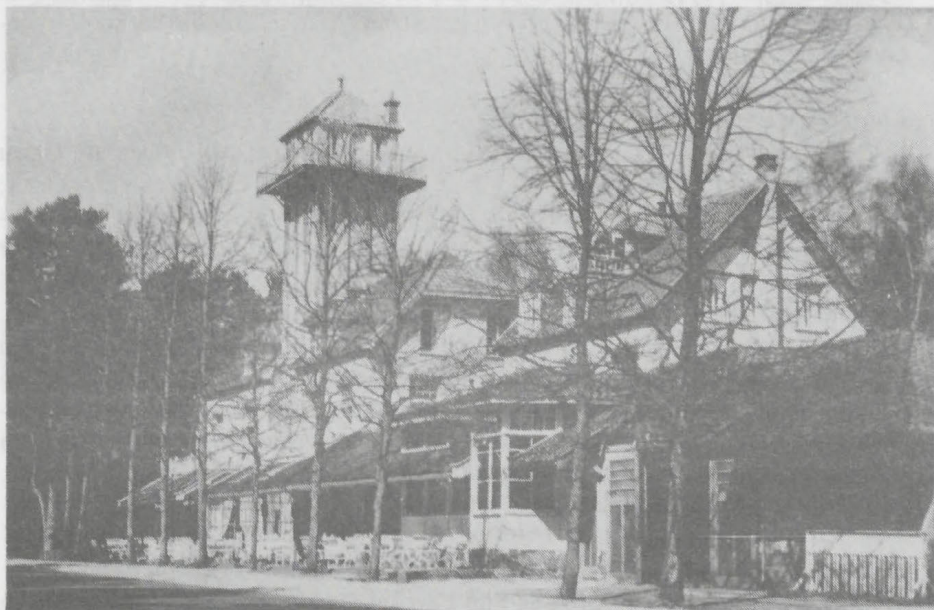
Hotel-café-restaurant De Vrijenberg (ca. 1954)