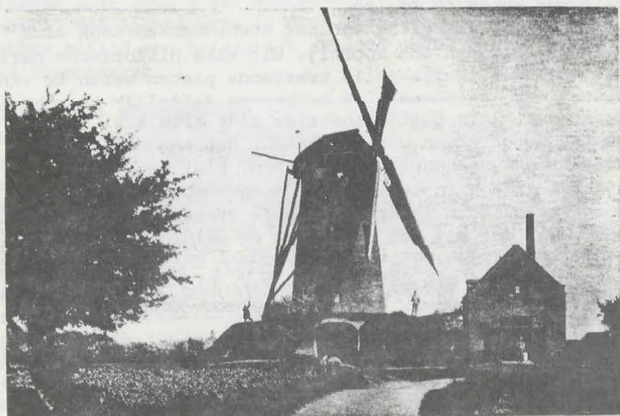
Oude Molen — Brummen