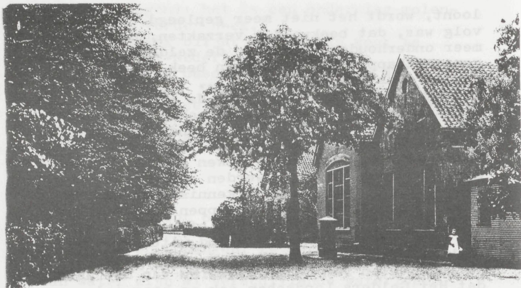
Groet uit EERBEEK.