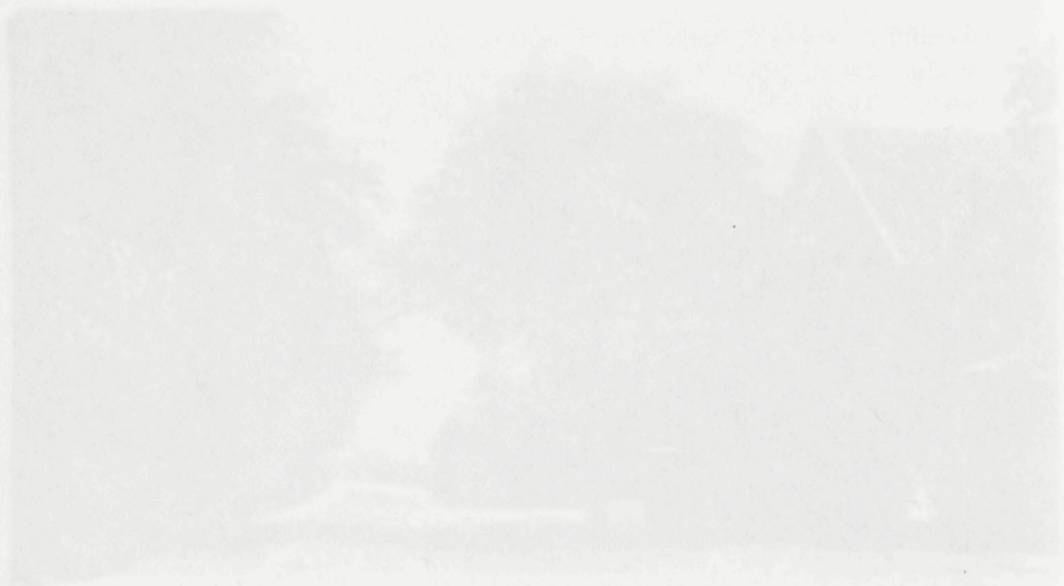
Fig. 1. A. 1900.