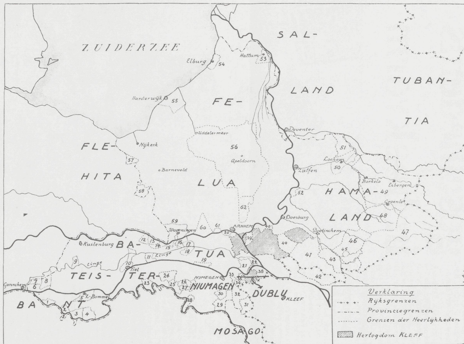
Kaartje van de Heerlijkheden en Gouwen vóór 1795; de namen der Gouwen in den Frankischen tiel zijn deso Epistole letters aangegeven